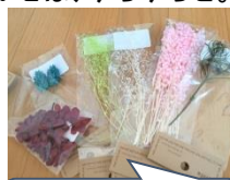
材料のプリザーブドフラワー。カラフル!

作り方自体はシンプルなので、ハンドメイドとしても人気。最近では、手芸店などで材料の取り扱いも増え、講習会を開催するところも出てきています。作り方はシンプルですが、それだけに、作り手のセンスが問われるところ。ガラス瓶・花材・飾り小物のセレクトや、作成時の配置のバランスがポイントになります。ハンドメイド販売のネットショップなどでも、たくさんの種類が販売されていますので、お気に入りを見つけてみてはいかがでしょうか。