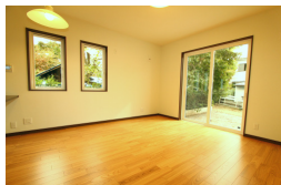
陽あたり抜群のリビング