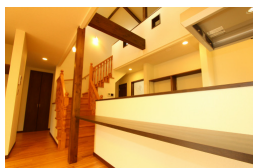
カウンターキッチンで料理も楽しい