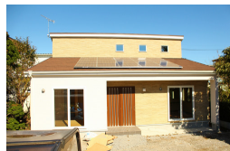
つくば市 S 様邸