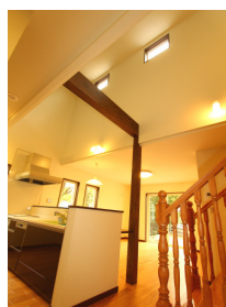
開放感あふれる吹抜け