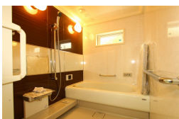
スピーカー付のお風呂で音楽が聴ける♪