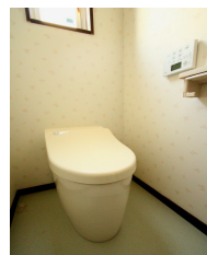
TOTOの先進技術が 忙しい朝に 満載の次世代トイレ