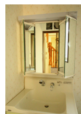
忙しい朝に 嬉しい五面鏡