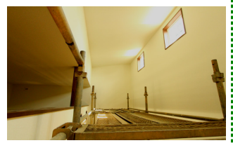
光をたっぷり取りこむ天窗