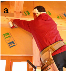
a. 気密テープ貼り。根気のある作業ですがこれを丁寧にやることで気密測定当日の結果にも影響が。

全国的に見てもなかなか出ない素晴らしい数値です！これには測定の方も「こんな数値見たことない」とビックリしていました。現場の職人さんの腕と真面目な作業が、気密性に優れたFPの家の仕様と合わさって素晴らしい結果となりました。このまま行くと、そのうち測定不能！なんて事もあり得るかも…笑。