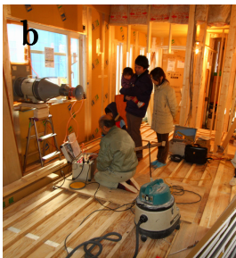
b. ご家族そろって見守ります。緊張の測定。