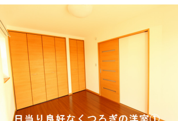
日当たり良好なくつろぎの洋室①