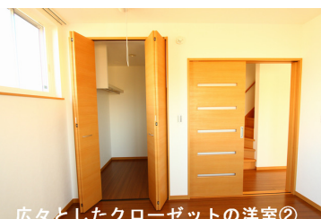
広々としたクローゼットの洋室②