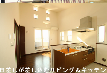
日差しが差し込むリビング&キッチン

実はこのステキなアパート、なんと建築段階ですですに問合せが殺到しお部屋が決まり、現状「 満室 」となってしまいました^^; 高気密住宅をお探しなら、是非セレクトホームにお気軽にご相談ください♪ アパートも戸建もマンションもお任せください!