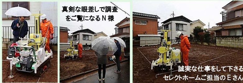
真剣な眼差しで調査 をご覧になるN様