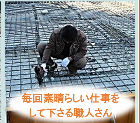
毎回素晴らしい仕事を 下さる職人さん

憧れのインナーガレージのあるお家を建てたい!!というお客様は是非ご連絡ください(∇・∇・∇)ノ セレクトホームがあなたの夢を叶えます!!! 施工例にもビルトインガレージのお家がありますので、ご安心してお任せください♪