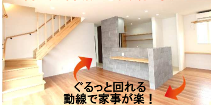
高気密・高断熱+床暖房で快適 LDK

引込み戸を開け放つとオープンになる和室。存在感のあるヒノキの化粧柱は、玄関やLDKからも眺められます。吊り押し入れの下に設けた地窓から、柔らかな光が広がります。