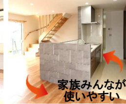
キッチンにも床暖房！