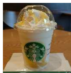
チーズサブリのアク セントも〇是非♪

浮いたお金で… 先日、気になっていた「レモン ヨーグルト 発酵フラペチーノ」 をスタバでいただきました。き っと、あま〜い感じだろうっ て思っていたのですが、意外とさ わやかで美味しい!