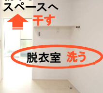
物干しスペースへ

天井までの3枚扉を引き込むとオープンになる使い勝手の良いパントリー。食器や調理器具、食材ストック、置き場所に困るゴミ箱もスッキリ収納できるように設計しました。