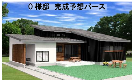
0様邸 完成予想パース