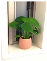
お手入れ簡単! hidroponics チャー

インテリアグリーン(観葉植物)は、どんなコーディネートにも効果的です。ホテルライクな高級感あるテイストや、シンプルナチュラルなテイストなど、お好みのスタイルに、ぜひ取り入れてみましょう。植物は人の心を癒してくれます。バスタイムのリラックスには欠かせないアイテムと言えるでしょう。葉形に丸みのある、「モンステラ」や「ポトス」などを選ぶと、優しく温かみのある印象に。また、栽培方法のオススメは、土の代わりに hidroponics という発砲煉石を使った水耕栽培の「 hidroponics チャー」。保水性にもすぐれ、水やりなどのお手入れがとても簡単です。鉢や鉢カバーの素材や色は、ディスペンサーなど他のバスグッズとの統一感をもたせ、バスルーム全体をお好みのスタイルにまとめるとよいでしょう。