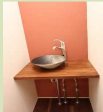
和室横の粋な手洗い