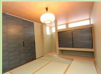
1階リビング横には品格ある和室。 上下を空けた抜け感のある収納が 部屋を広く見せてくれます。照明と 建具のセンスはさすがです。