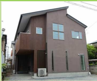
ダークブラウンのドイツ漆喰と 国産杉の外観はシックで落ち着いた 雰囲気。